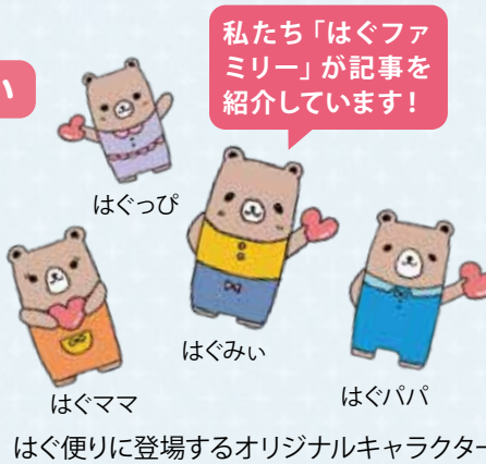
はぐママ はぐみい はぐパパ はぐ便りに登場するオリジナルキャラクター

子育て中のお父さんやお母さんはもちろん、おじいさんやおばあさんなど家族みんなで、ぜひ読んでみてください。また、子育てに興味・関心がある人にもお勧めです!