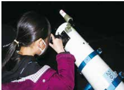
天体望遠鏡を使った天体観測の様子