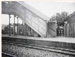
啄木が利用した好摩駅 (今年で開業130周年)