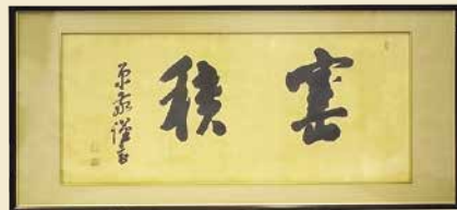
原敬書「寶積」 自由民主党本部蔵