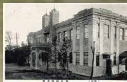
岩手県物産館 (大正期発行)