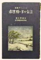
宮沢賢治 著書 『注文の多い料理店』

●日時:2月5日(土)13:30～15:00 ●会場:盛岡市先人記念館 地下ホール ●講師:宮澤明裕氏(宮沢賢治記念館学芸員) ●定員:40人 ●受講料:無料 ●申し込み:1月22日(土)9:00から電話(659-3338)にて先着順に受け付け