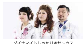
ダイナマイトしゃかりきサ〜カス

【15:00開演(14:00開場) 全席指定】 ※未就学児はこ入場いただけません [前売料金]S席4,500円 A席3,500円 U-25チケット(S・A席選択可)1,500円(当日各500円増) 【Friends料金】S席4,050円 A席3,150円 ※U-25チケット対象外