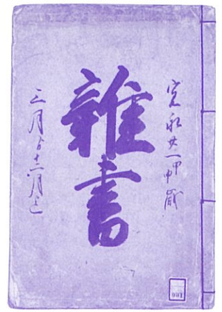
盛岡藩家老席雑書 寛永21年(1644)

◎雑書…書物の分類上、所属のはっきりしない種々雑多なもの 【日本語大辞典(小学館)】