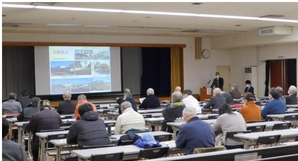
（令和2年度の研修会の様子）