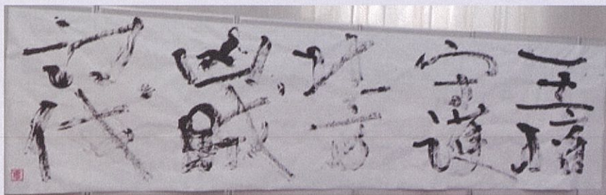
「王権守護北方凶賊討伐」 160×700 2021年