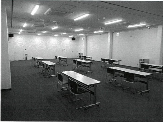
※企画展示室使用例

絵画や写真などの各種展示のほか、朗読会や会議などにもお使いいただけます。貸出期間や施設の詳細は、中央公民館まで直接お問い合わせください。皆さまのご利用をお待ちしています。