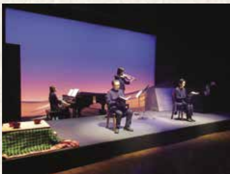
前回の公演の様子

IBCラジオで放送している朗読番組「ラジオ文庫」(月曜PM12時45分)の実質制作スタッフは、読み手2人とディレクター1人の3人です。それが同じ朗読でも、舞台公演となると9人プラス数人になります。読み手2人は変わらず、演出、舞台、スライド・音響、照明、制作、音楽演奏、そして劇場関係者の助けを必要とします。