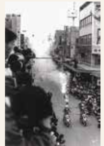
大通商店街から岩手公園に向かう聖火ランナー

第4コースの聖火は9月21日に青森県三戸町から金田一村(現二戸市)に引き継がれ、翌22日に盛岡市の岩手公園(盛岡城跡公園)で待っていた市民に盛大に迎えられました。