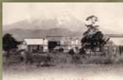
岩手県師範学校 第一校舎 (大正以降発行)