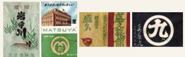
左から浜藤酒造店、松屋、盛久旅館、眞藤九のマッチラベル

明治26年(1893)には国内初の宣伝用の広告マッチが作られ、デパートやフルーツパーラー、喫茶店、カフェ、旅館、ホテルなど、さまざまな広告マッチが作られるようになりました。家庭用マッチに比べると数量も少なく影の薄い存在でしたが、戦後は需要が増加し昭和35年(1960)にはマッチ生産量全体の39%に達しました。