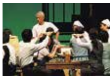
第2回「劇団モリオカ市民」公演 『わたしのじゃじゃ麺』より

*購入時は日時指定のみ、座席の選択はございません *開場時は半券を切らずにチケットをご提示のうえ、ご入場いただきます *入場後はご希望のお席を確保していただき、速やかにチケット半券に【お名前・ご連絡先・着席いただくお席の番号】をご記入のうえ、切り離して、ロビーの回収箱へご提出ください