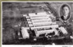
岩手県師範学校全景 (昭和11年発行)