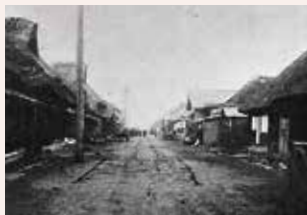
洪民村の旧奥州街道

・所在地/盛岡市洪民字洪民9 TEL019-683-2315 ・休館日/毎週月曜日(3月の休館日は7、14、22、28日)※21日は開館