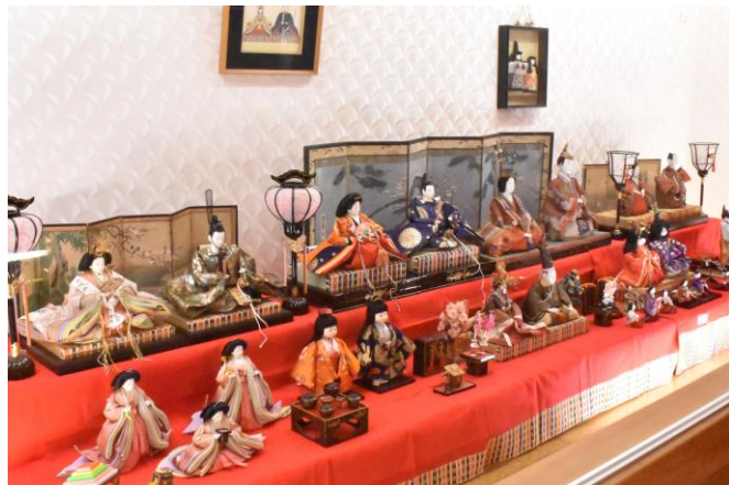
昨年度の展示の様子