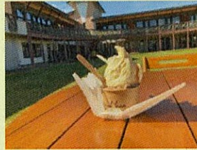
温泉ジェラートの割引もありますよ