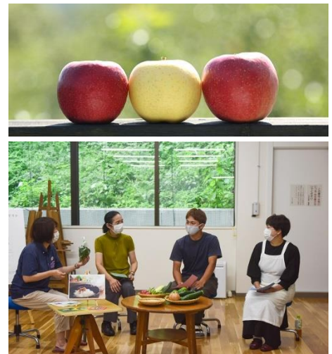
7月に開催した夏のごはんの会の様子