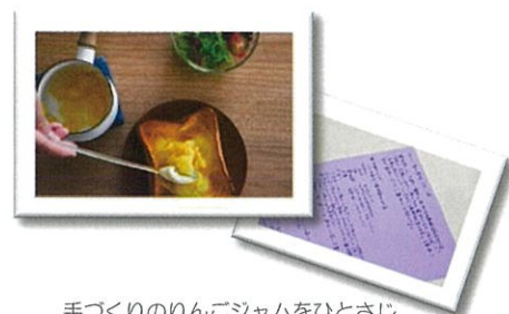
手づくりのりんごジャムをひとさじ 食卓に秋の旬を添えてみます