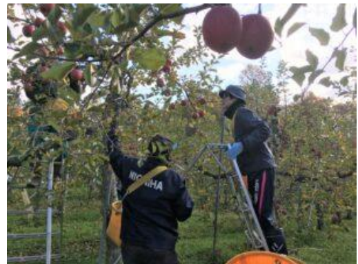
はしごを使ったりんご収穫の様子