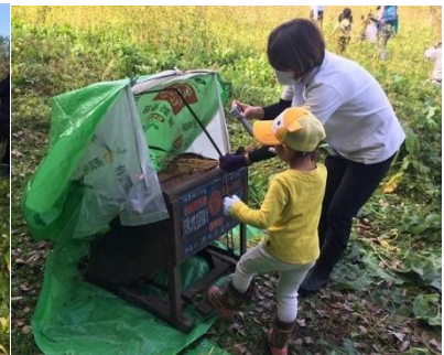
前回（10/9）行った収穫・脱穀作業の様子