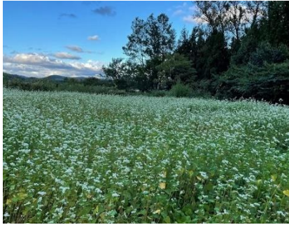
9月中旬 そばの花が満開