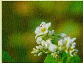
そばの花は見頃にご案内いたします