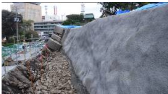
三ノ丸北西部石垣内部