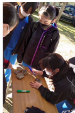
裏込め石に書き込む様子