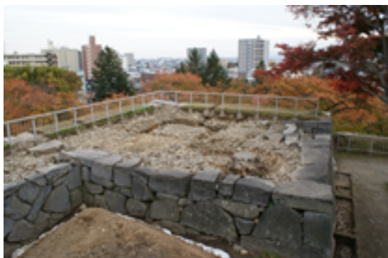
本丸三階櫓の天守台