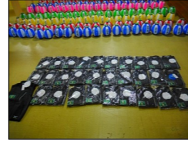
内丸第二町町内会