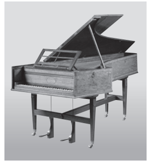
ジョン・ブロードウッド