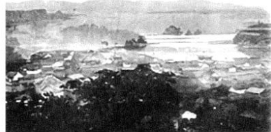
高田松原 (3代目の啄木歌碑)