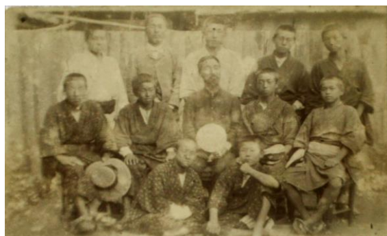
明治33年修学旅行写真 (2列目右端が啄木)