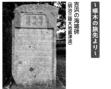
吉浜の海嘯碑 明治三陸大地震津波