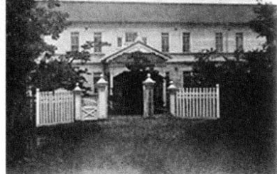
気仙沼町(明治41年)