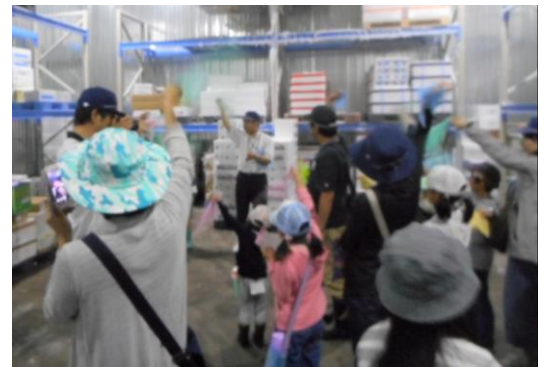
冷凍庫体験の様子