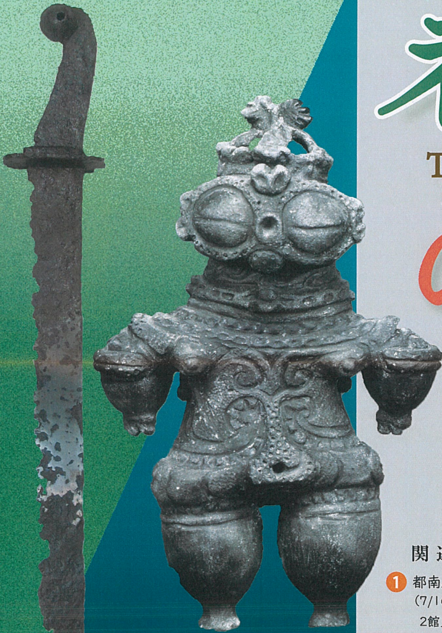
▲ 国指定重要文化財 土偶 (手代森遺跡出土) : 複製 ◀ 手刀 (下永林遺跡 大道西古墳出土)