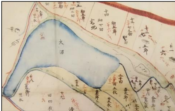
江戸時代の現大沼バス停留所付近の様子

本展では、藩政時代から平成4年の盛岡市との合併に至るまでの都南地域の歴史とそこに住む人々によって継承され育まれてきた伝統や文化、都市化による人々の生活の変化の様子について、資料や写真パネルを通して紹介します。