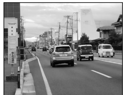
津志田地域の写真 （昭和20年代前半と令和3年）