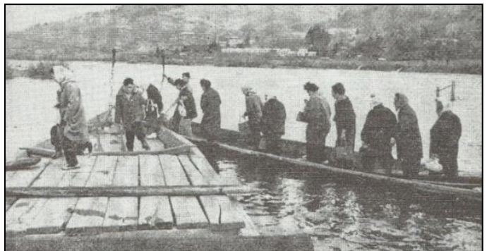
昭和40年代の三本柳渡船場の様子