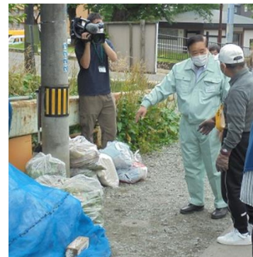
令和3年度の実施の様子