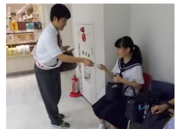
▲ 街頭巡回活動の様子