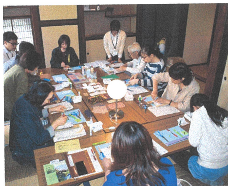
令和元年度の作業風景