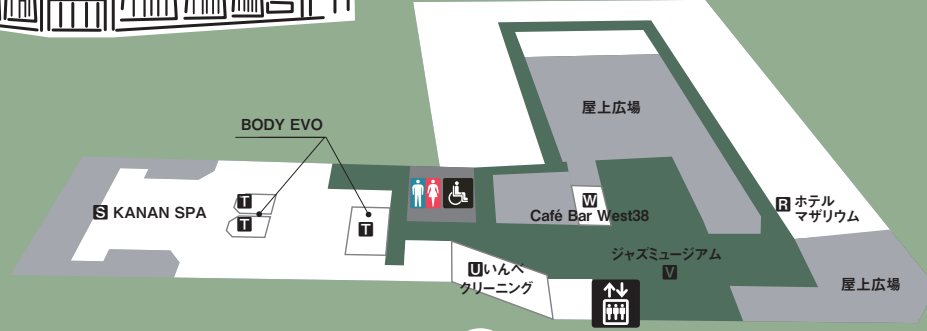
HOTEL MAZARIUM 3F ホテル・スパ / サウナ・ジャズミュージアム

●営業時間 5:30~9:00(最終入場8:15) / 12:30~21:00(最終入場20:00) ●料金 5:30~9:00 / 12:30~15:00 大人(中学生以上):990円 / 小学生:450円 / 幼児:220円 15:00~21:00 大人(中学生以上):1,250円 / 小学生:650円 / 幼児:220円 ※バスタオル・フェイスタオルの レンタル料金込み