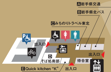
バス待合室・発券窓口 券売所 9:00~18:00 待合室 6:00~22:30 西棟 1F 東棟 マルシェ 7:00~20:00