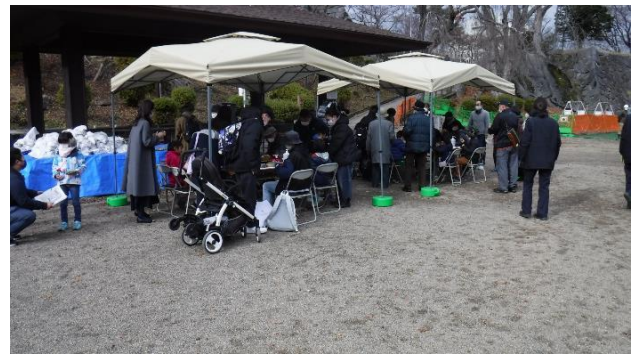
栗石にメッセージを書き込む様子