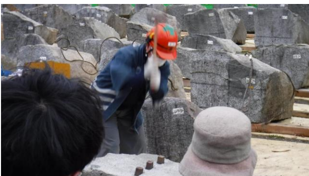
石割デモンストレーション