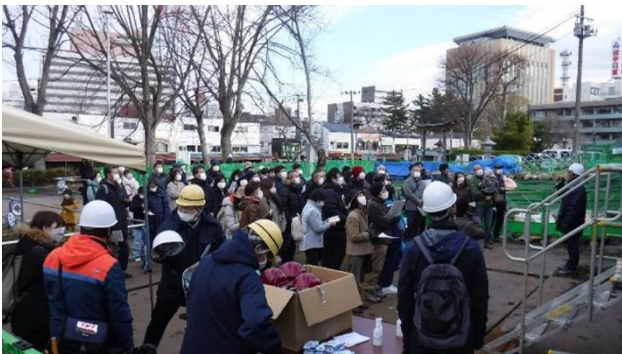
昨年度の説明会の様子