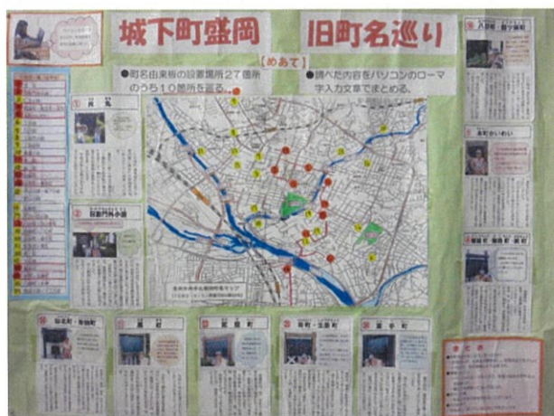
「城下町盛岡旧町名巡り」 仙北小学校 6年生