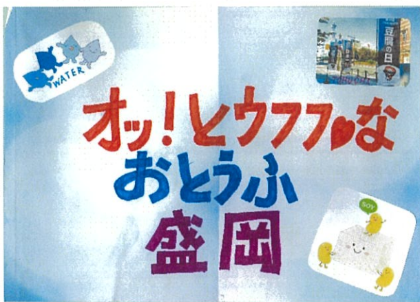
「オッとウフフなおとうふ盛岡」 飯岡小学校 4年生

【その他】添付資料「第4回もりおか歴史文化館自由研究コンクール【モリガク】作品展」チラシ