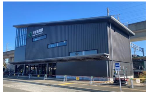
西口外観 ※令和4年10月27日撮影