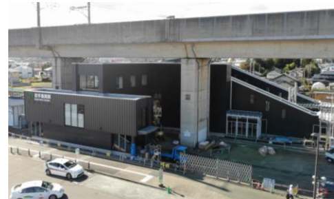
東口外観 ※令和4年10月24日撮影