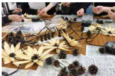
経木とまつぼっくりの花づくり (若者サポートステーションリースボランティア)