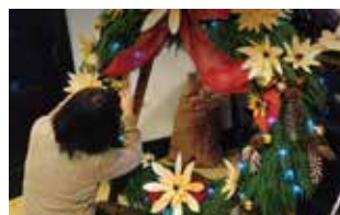
ポイントリースの製作