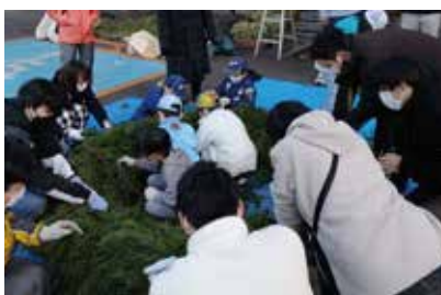
シンボルリースへの杉の差し入れ (盛岡広域森林組合青年部)