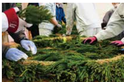
まちなか展示リースの製作 (岩手県立盛岡峰南支援学校生徒)