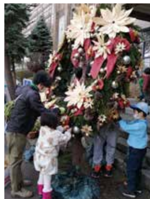
シンボルリースの設置