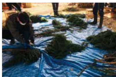
リースに使用する杉の準備 (外山森林公園サポータークラブ、ひめかみの風、ハートフルワークいわて)