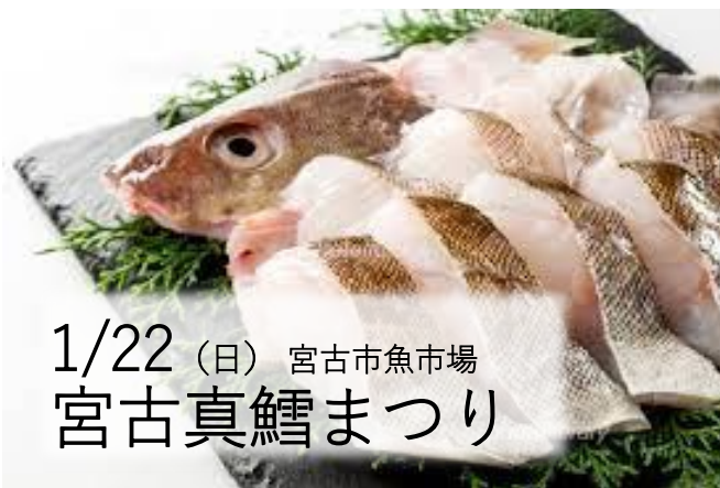
1/22 (日) 宮古市魚市場 宮古真鱈まつり