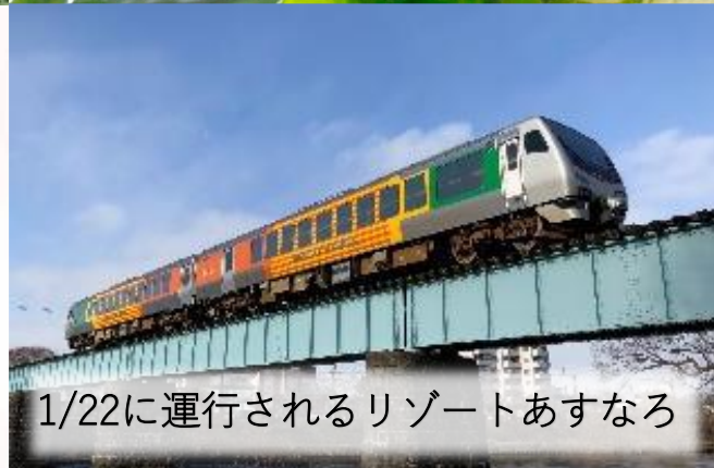
1/22に運行されるリゾートあすなろ

宮古市で開催される冬の味覚を楽しむイベントに、JR山田線を使って行ってみませんか。対象列車・区間を利用された方には、盛岡銘菓のプレゼントや、ミスさんさ踊りのお見送り（2/5を除く）もあります。ぜひこの機会に、ゆったりとした列車の旅を楽しみましょう。