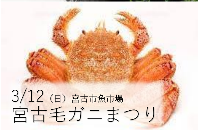
3/12 (日) 宮古市魚市場 宮古毛ガニまつり