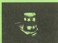
コップ de ランタン