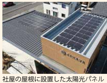
社屋の屋根に設置した太陽光パネル

太陽光パネルで発電する創エネ、高効率電気設備と高断熱などによる徹底した省エネを実現。消費する年間のエネルギー収支ゼロを目指した建物「ZEB」として、県内で初めて建てられました。会社としてSDGsの目標達成にも取り組んでいます。