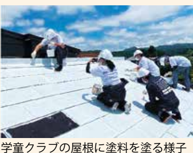
学童クラブの屋根に塗料を塗る様子

宇宙技術から開発された断熱性能が高い塗料を屋根や外壁、室内などに塗装し、冷暖房に必要なエネルギーを削減。子どもたちのために、市内で複数の学童クラブの屋根に、ボランティアで塗装する活動もしています。