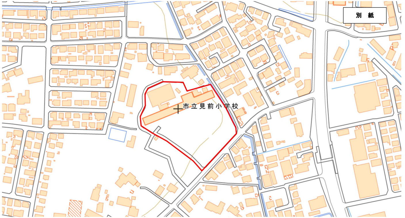
盛岡市立見前小学校校舎大規模改修（建築主体）工事 位置図