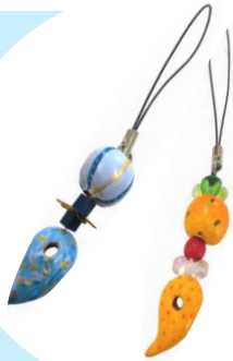
古代風ストラップ