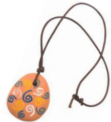
お守りネックレス