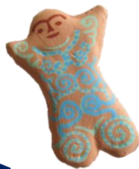
板状土偶マグネット