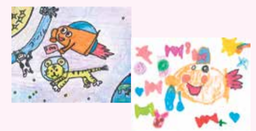
▲昨年度のコンテスト入賞作品

■こかぼう似顔絵コンテスト作品展 同コンテストの応募作品を展示します。 ① 2月1日(水)～3月26日(日)、9時～16時半 ② 展示室の入館料が必要