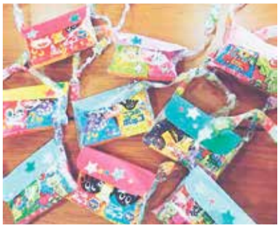
▲防災お菓子ポシェット

⑦ メール・往復はがき：必要事項を記入し、☎020-0834永井24-10-1都南公民館へ送付。2月7日(火)必着 ⑧ 1037013