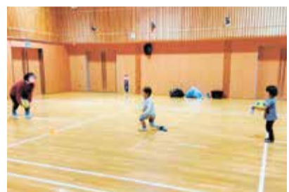
過去の教室の様子

まつぞのスポーツクラブ ☎663-9280 ドイツ発祥で、誰でも参加できるボール運動のバルシューレ※を楽しめます。詳しくは、同クラブのホームページをご覧ください。 ※148種類を超えるボールゲームを通してさまざまな体の動きを経験する運動のこと ③ ①3月6日～27日、月曜②3月1日～22日、水曜、各全4回、15時～16時 ① ①高松地区保健センター(上田字毛無森) ②松園地区公民館(東松園二) ① 各8人※令和4年度に4～6歳になる子 ¥ ①②3000円 ☎ 同スポーツクラブのホームページ: 2月28日(火)16時まで※先着順