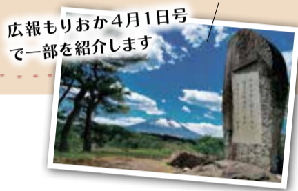
広報もりおか4月1日号で一部を紹介します