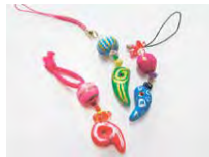
▲古代風ストラップ

■縄文ふれあいDAY 古代風ストラップ・拓本とり・古代のお守りネックレスから1つを選んで作ります。 🕒 3月11日(土)、10時～11時半、13時～14時半 💰 各100円※別途入館料が必要 📄 1009438