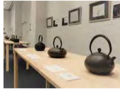
▲過去の特別展の様子

■特別展「南部鉄器展2022」 盛岡を中心に活躍する南部鉄器工場の職人が作った作品を展示します。 🕒 3月12日(日)～26日(日) 📄 1020948