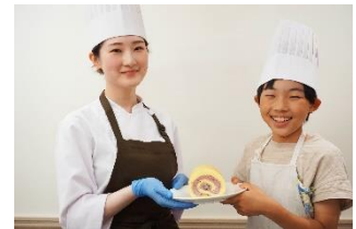
【ロールケーキ作り イメージ】

企画・運営：もりグリフェス事務局（盛岡ターミナルビル株式会社）／ ホテルメトロポリタン盛岡