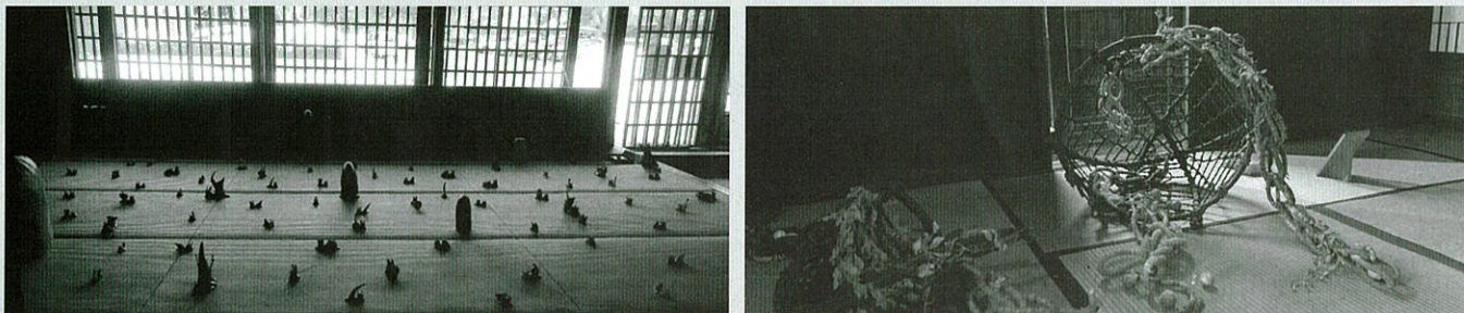
アートガーデン2022会場風景(旧中村家住宅)

来場される皆さまに、歴史ある建物と現在を生きるアートとが融合された新たな魅力を体感していただければ幸いです。