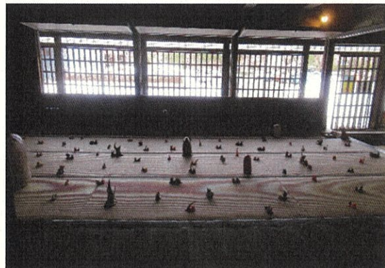
昨年度（アートガーデン2022）の展示風景