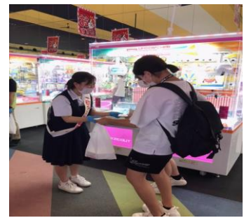
▲ 街頭巡回活動の様子

【場所】 《一日少年補導委員委嘱状交付式》 盛岡市民文化ホール（マリオス）5階第2会議室 盛岡市盛岡駅西通二丁目9番1号 ☎019-621-5000 《街頭巡回活動》 2コース（会場から盛岡駅周辺）