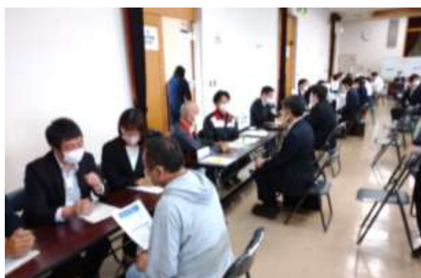
▲ 第2部：相談会の様子（5月） ▲