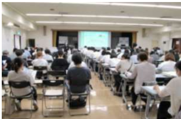
▲ 第1部：プレゼンスピーチの様子（7月） ▲