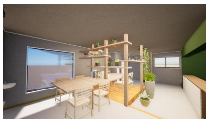
▲事業所内装イメージ