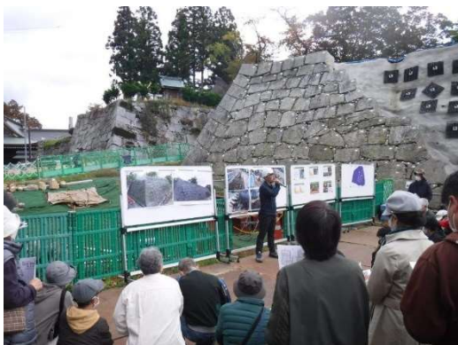
昨年度の説明会の様子