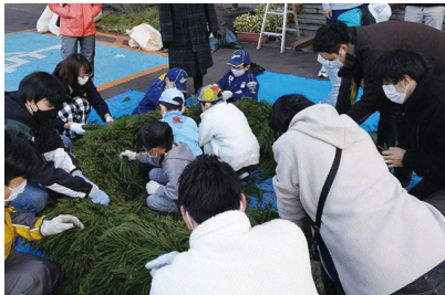
シンボルリースへの杉の差し入れ (盛岡広域森林組合青年部)