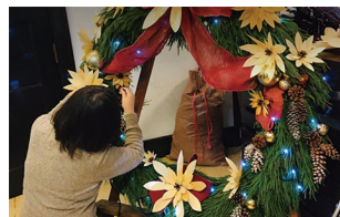
ポイントリースの製作