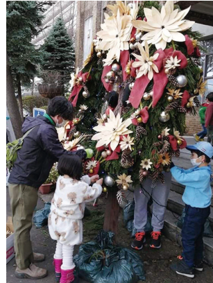
シンボルリースの設置