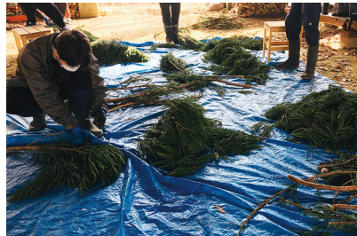
リースに使用する杉の準備 (外山森林公園サポータークラブ、ひめかみの風、ハートフルワークいわて)