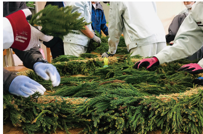
まちなか展示リースの製作 (岩手県立盛岡峰南高等支援学校生徒)