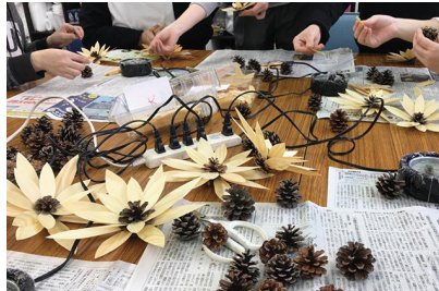
経木とまつぼっくりの花づくり (若者サポートステーションリースボランティア)