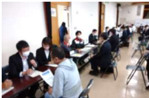
▲ 第2部：相談会の様子（5月） ▲