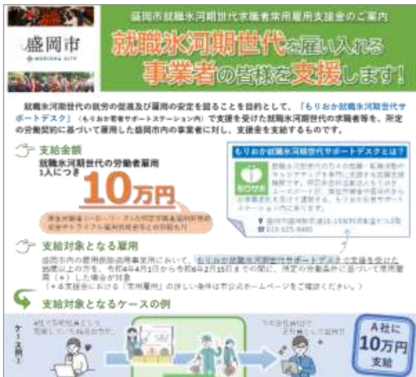
▲ 常用雇用支援金案内チラシ ▲