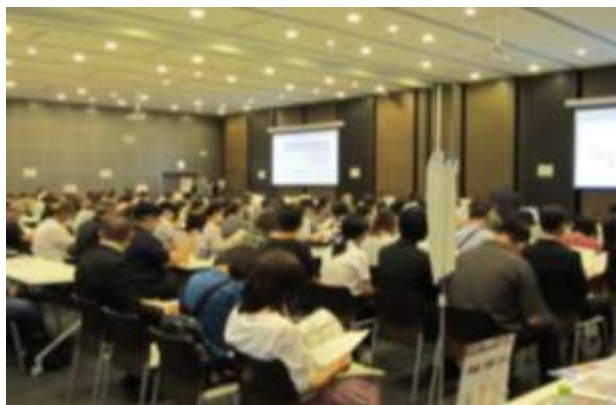
▲ 第1部：プレゼンスピーチの様子（9月） ▲