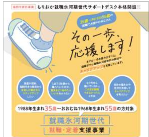
▲ サポートデスク紹介チラシ ▲