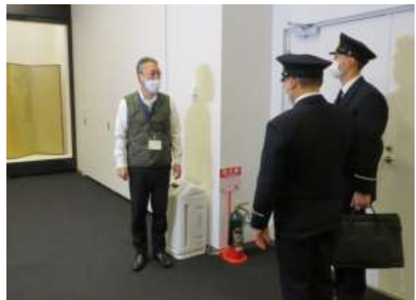
昨年の特別査察の様子(もりおか歴史文化館)