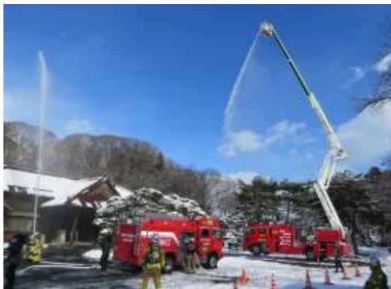
昨年の防御訓練の様子(盛岡市中央公民館)

※当日、上記各場所における取材は、担当職員の到着後に開始してください。御協力をお願いいたします。