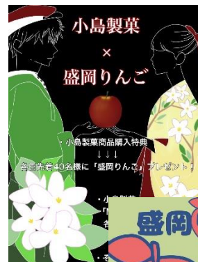
▲岩手県立大学「鷺風祭」での盛岡りんご PR