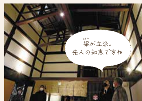
は、梁が立派。 先人の知恵ですわ

鉈屋町め組の流れをくむ市消防団第2分団が保管する山車を見学。ミニチュアにも興味深々。