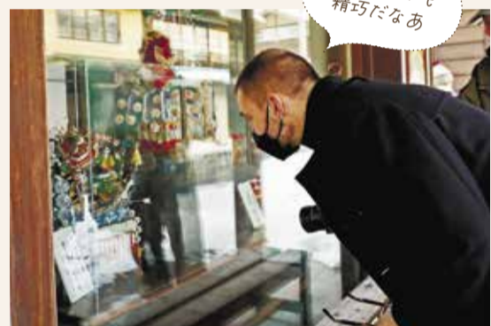
ミニチュアも 精巧だなあ