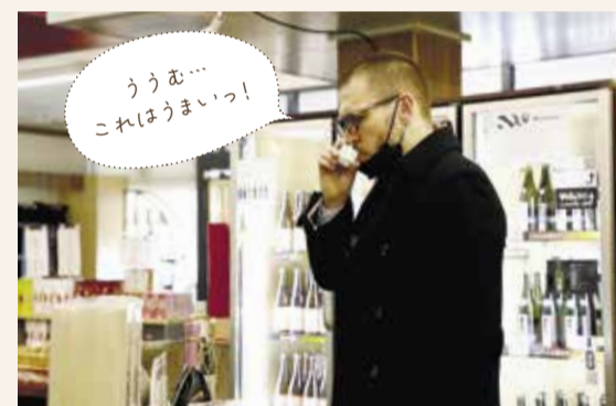
ううん... これはうまいっ!