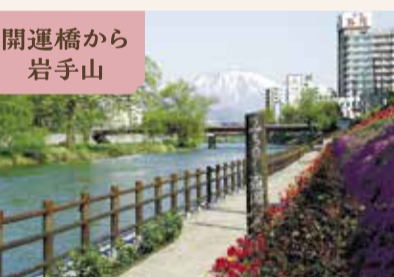
開運橋から岩手山