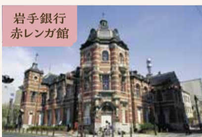
岩手銀行赤レンガ館

盛岡の街は歩きやすいと話すモドさん。盛岡城跡公園を中心に、西洋と東洋の建築美術が融合した大正時代の建物や、モダンなホテル、古い情緒ある旅館、清らかな川などが点在する街を歩く中で魅了されたとのこと。