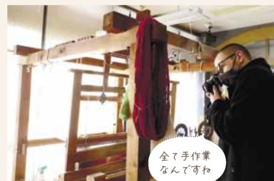
全て手作業 なんでもすわ