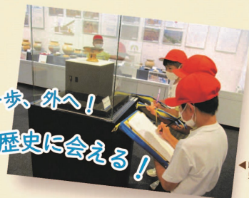
展示室での 見学の様子

遺跡の学び館は、盛岡市内にある 遺跡の発掘調査や考古資料の展示室、 体験学習などを行う考古歴史系博物館です。