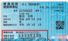
▲健康保険証例 保険者を確認(協会けんぽホームページより)