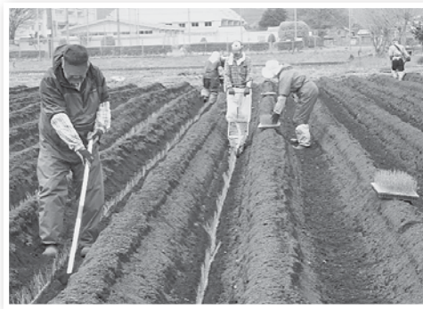
長ネギの定植作業 (ゆいっこクラブ)

遊休農地の解消・活用に取り組む、『ゆいっこクラブ』は、今年で活動5年目を迎えました。