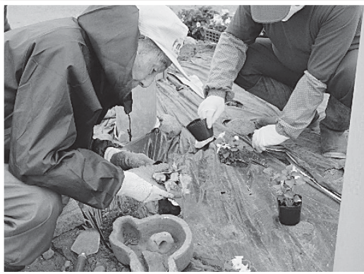
花壇の植栽活動 (飯岡新田)

令和3年5月16日、飯岡新田10地割の花壇で植栽活動が行われました。河南子ども会と河南自治会、都南北部農地・水協議会の共催で、同子ども会や自治会の会員をはじめ15名が参加。サルビア、ペゴニア、マリーゴールドなど70株の苗を植えました。