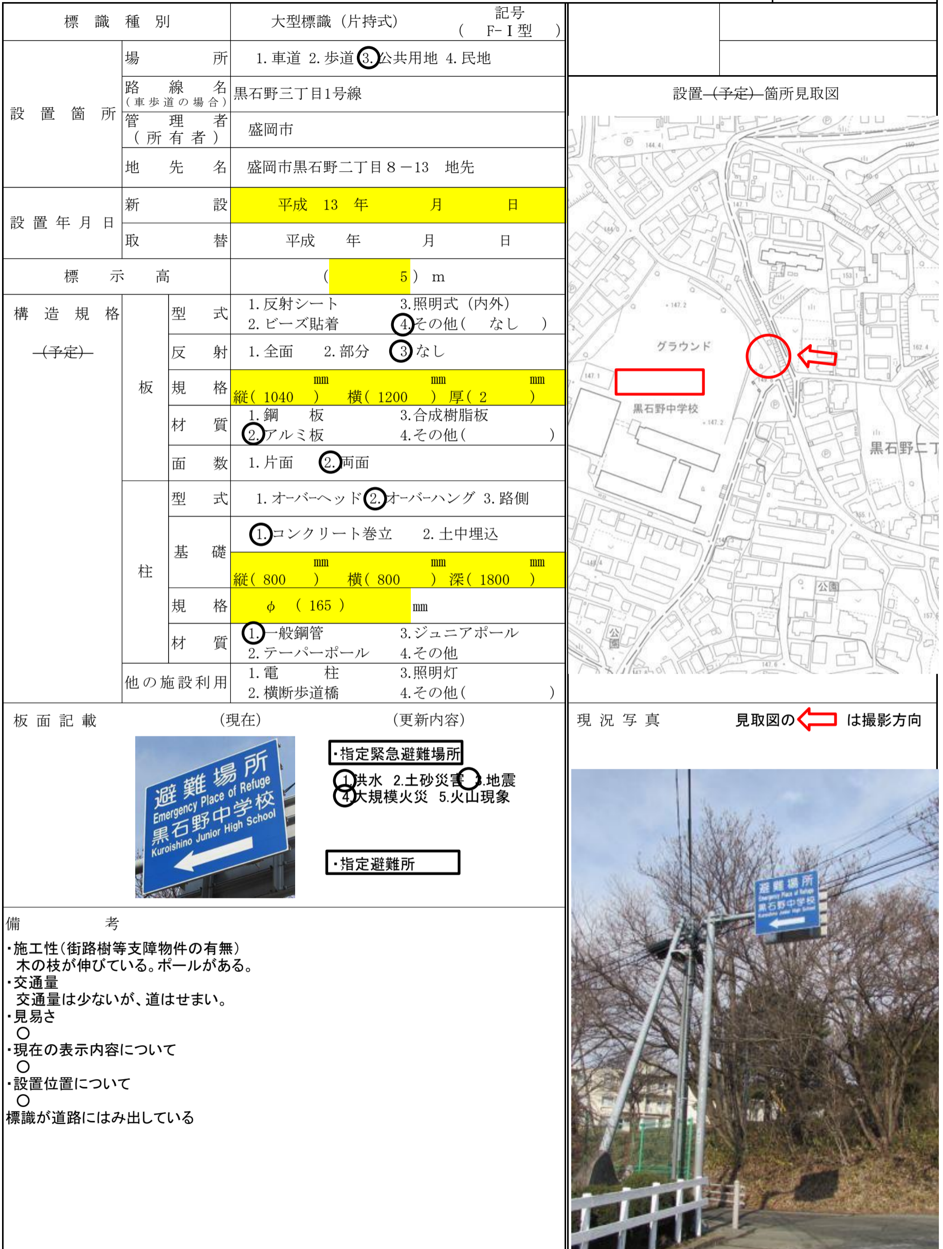
図-No. (19- )