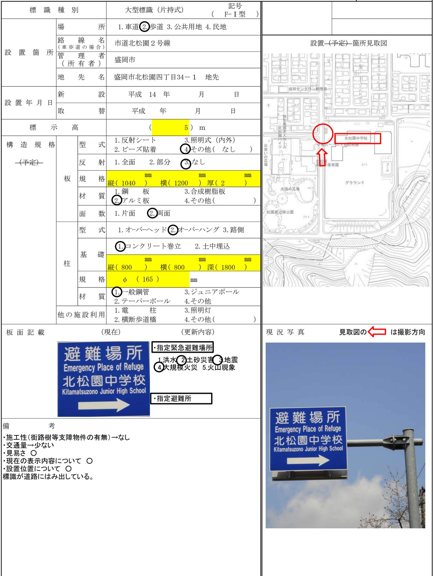
図-No. ( 33 - )