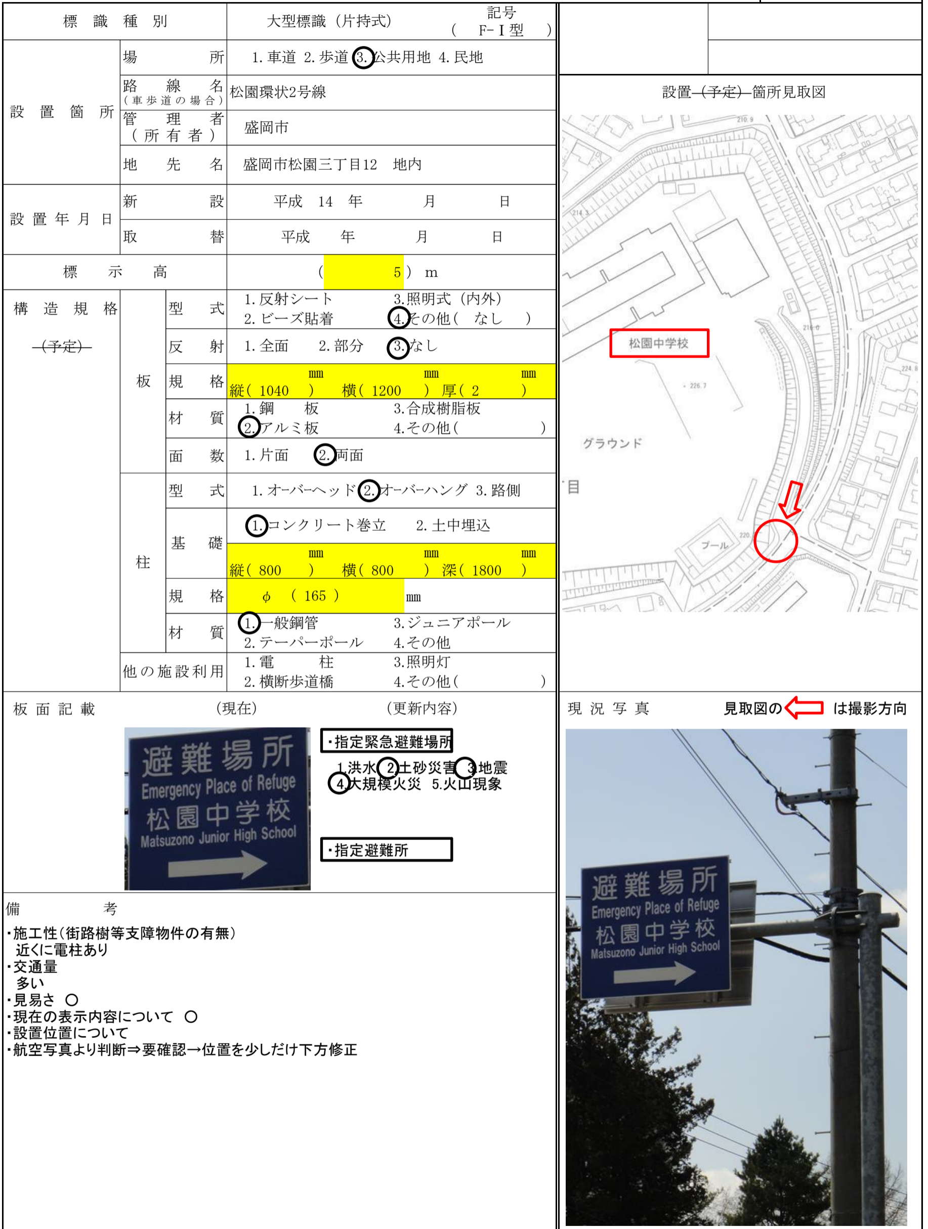
図-No. ( 25 - )