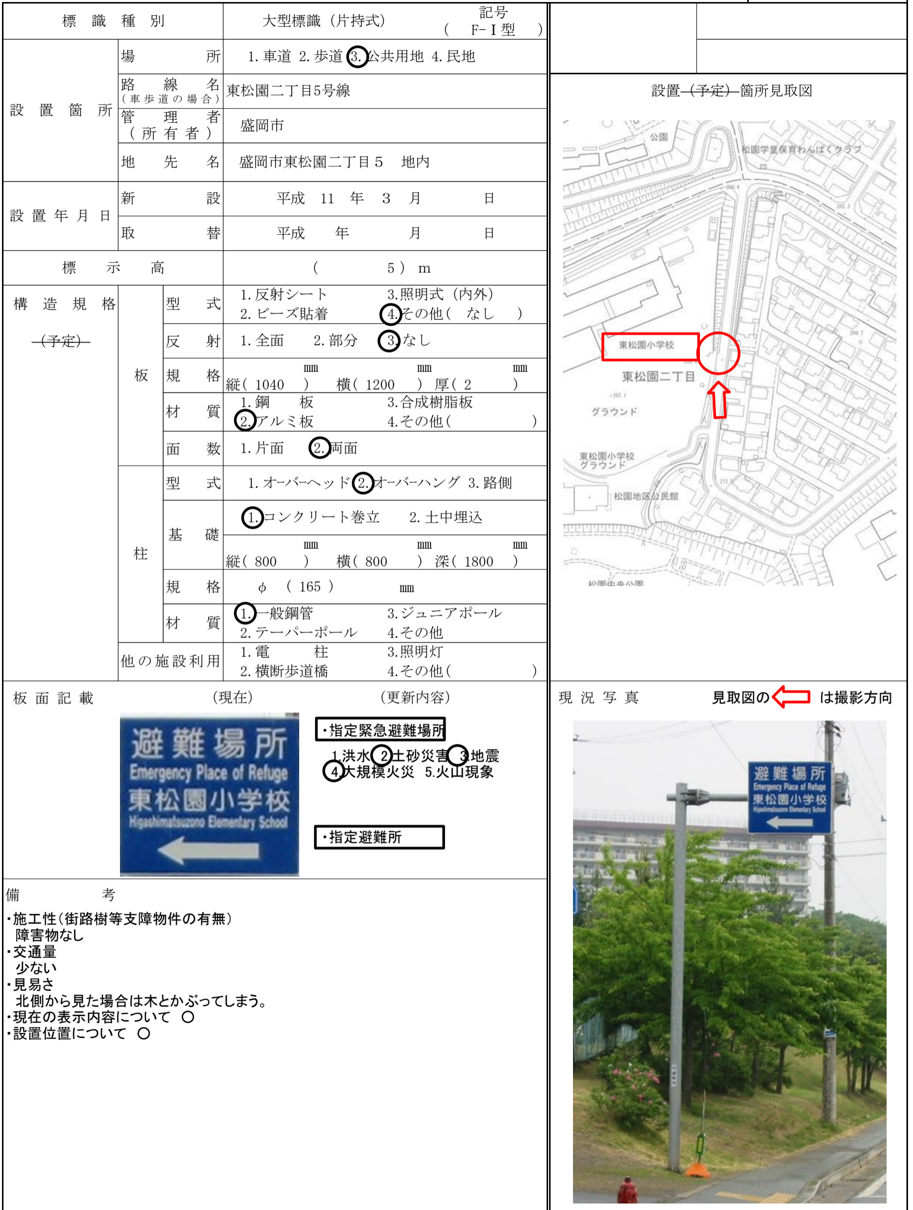
図-No. ( 29 - )