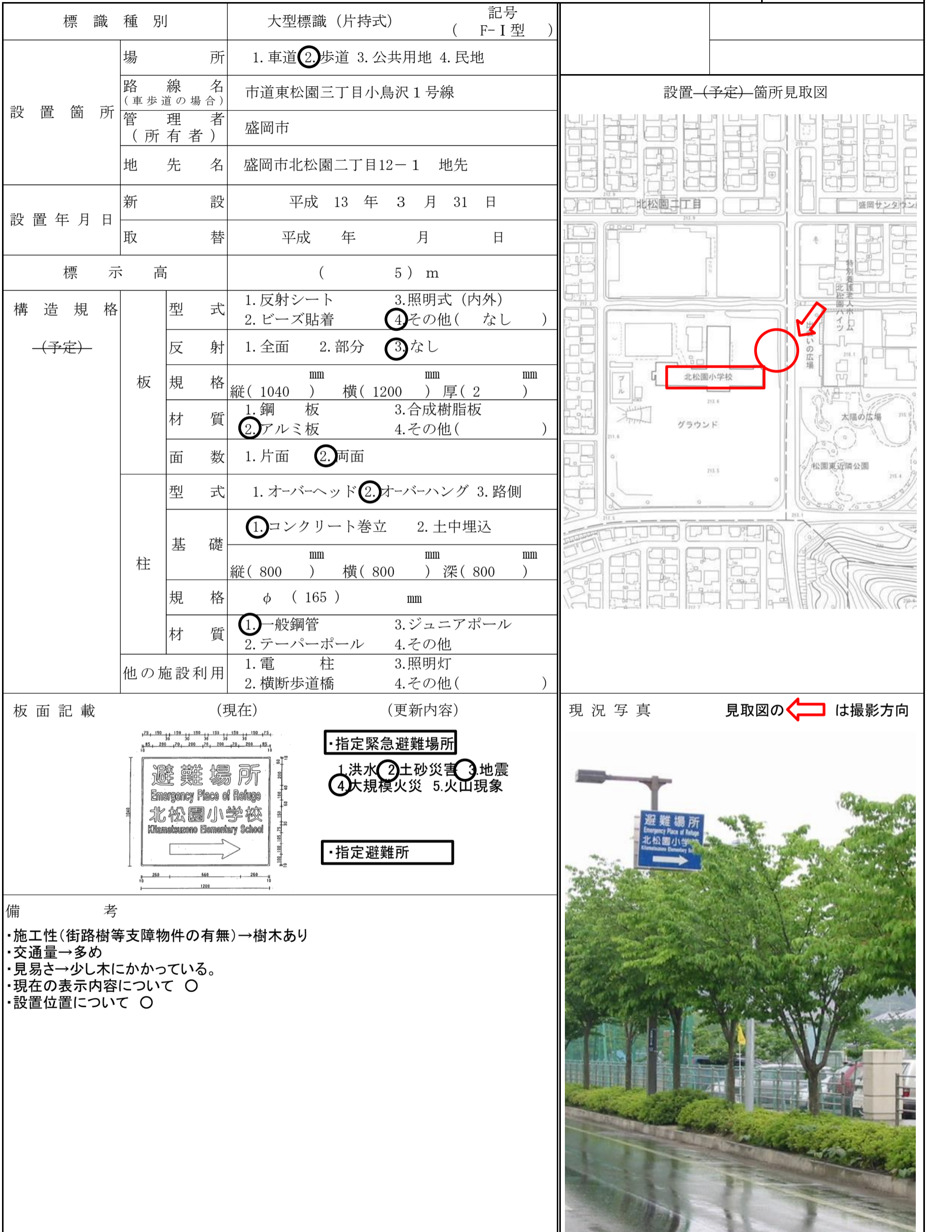
図-No. ( 32 - )