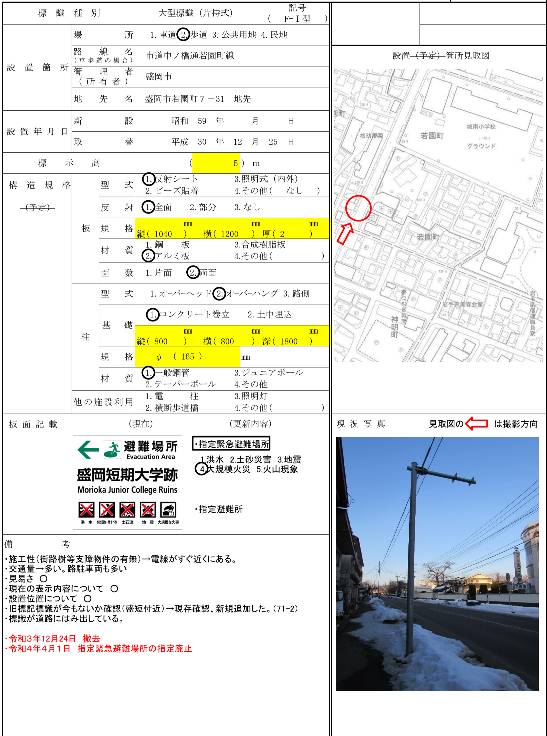
図-No. ( 146 - 1 )