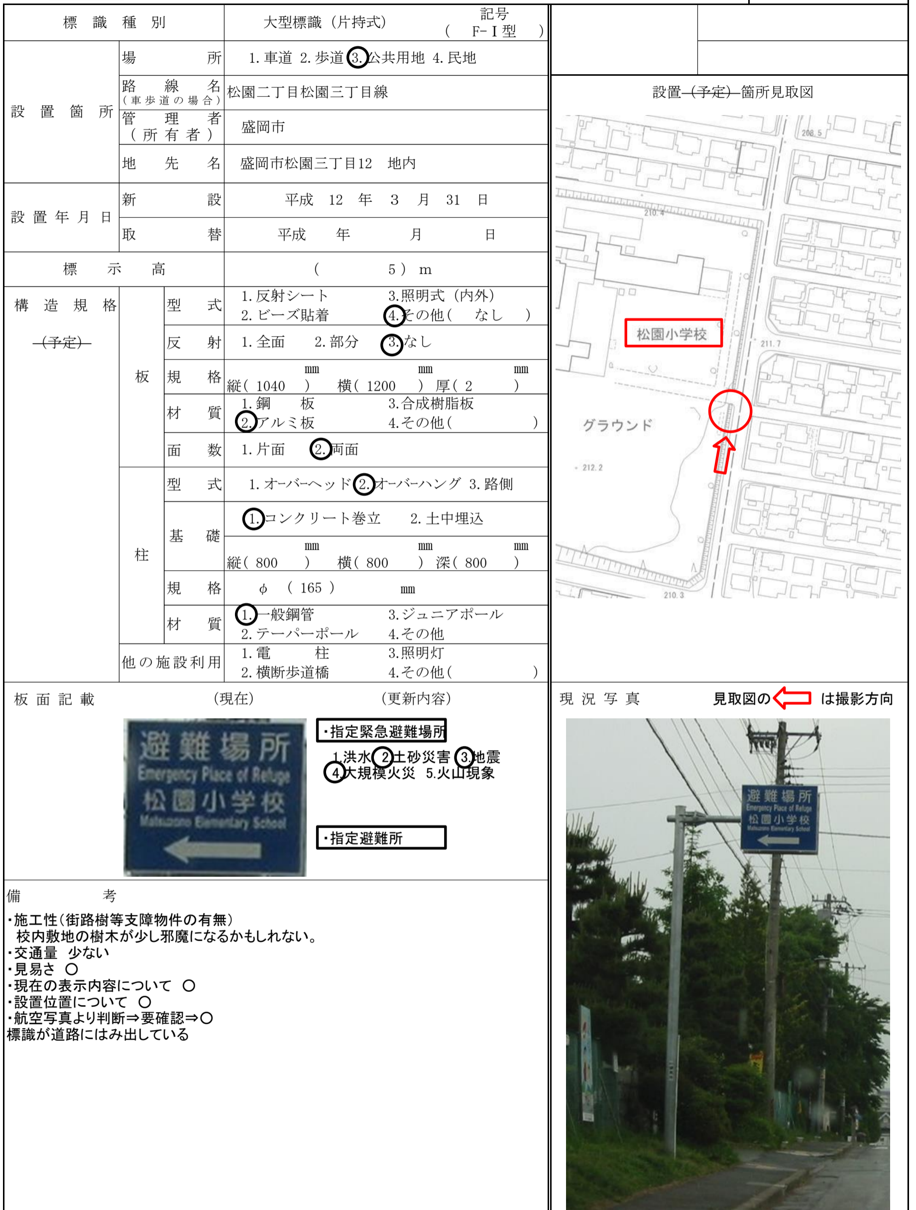
図-No. ( 24 - )