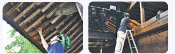
▲移築建築物調査風景

このような伝承が残る建物などについて、所有者のご協力をいただき、現在までに14件の調査を実施しています。