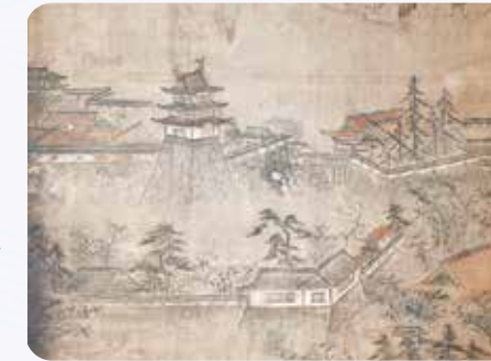
▲かつての盛岡城の建物の一部分 ※「六曲一双盛岡城下絵屏風」より(市指定有形文化財/光台寺所蔵※非公開)

戊辰戦争を経て、盛岡城が明治政府の直轄地となると、次第に城内の建物の維持管理が困難となります。明治7(1874)年3月には、城内の建物のほとんどが払い下げられることとなり、多くの建物が撤去されました。