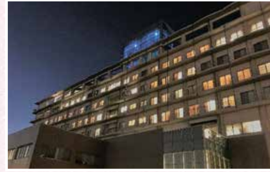
▲毎年11月上旬に世界糖尿病デーに合わせてブルーライトアップする市立病院

市立病院は、一般診療や各種健康診断のほか、救急医療にも対応するなど、皆さんの健康のために必要な医療を提供しています。また、新型コロナウイルス感染症やインフルエンザへの対策を徹底し、いつでも安心して受診できる環境を提供しています。令和4年度の決算と主な取り組みをお知らせします。【問】市立病院総務課 ☎635-0101