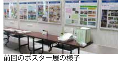
前回のポスター展の様子